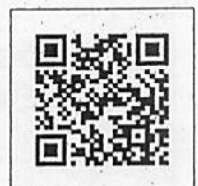
▲半田市ワクチン接種 予約受付サイト

※予約については、半田市ワクチン接種予約受付サイト ( https://v-yoyaku.jp/232050-handa 、24時間受付可能) または半田市新型コロナウイルスワクチン接種コールセンター (TEL0570-08-5670、平日9時～17時)にてお願いします。