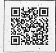
▲半田市ワクチン接種 予約受付サイト