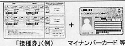
「接種券」(例) マイナンバーカード 等