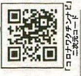
「コロナワクチンナビ」 二次元コード